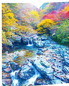
奈良県：みたらい深谷