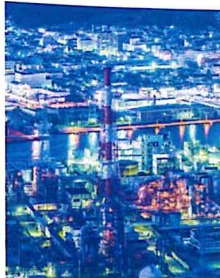
和歌山県：北部臨海工業地帯